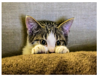
Fig. 6a: 겁쟁이

‘겁쟁이’는 지나치게 조심스럽거나 신중한 사람들을 일컫는 부정적인 단어이다. 이런 사람들은 실패에 대한 두려움, 수치 또는 상처 때문에 위험을 감수하는 것을 피하려 한다. 로버트 프로스트(Robert Frost) 시인은 사람들이 주의깊은 결정을 해야한다는 데 동의했다. 그는 “울타리리가 왜 서 있는지를 알 지 못하는 한 그 울타리를 없애지 마세요.” 라고 했다.